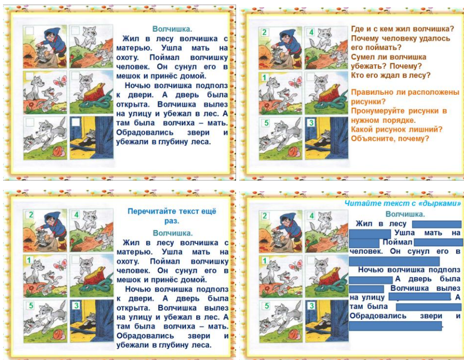
Приложение 12 (с электронным носителем)